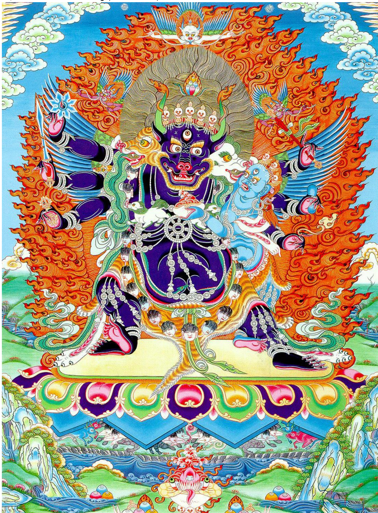
16) Đại Oai Đức Minh Vương (Yamantaka):