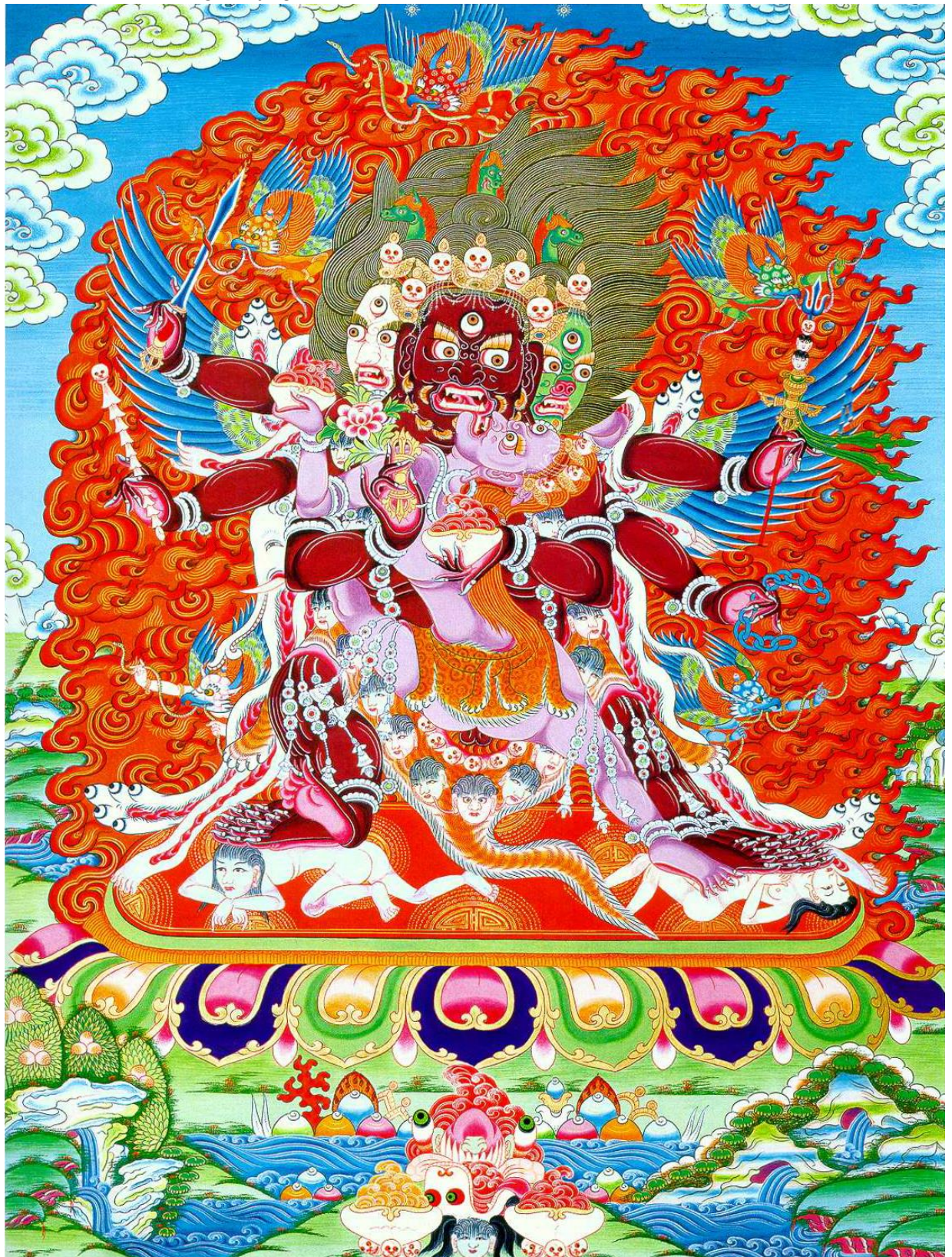
10) Mã Đầu Minh Vương (Hayagriva):