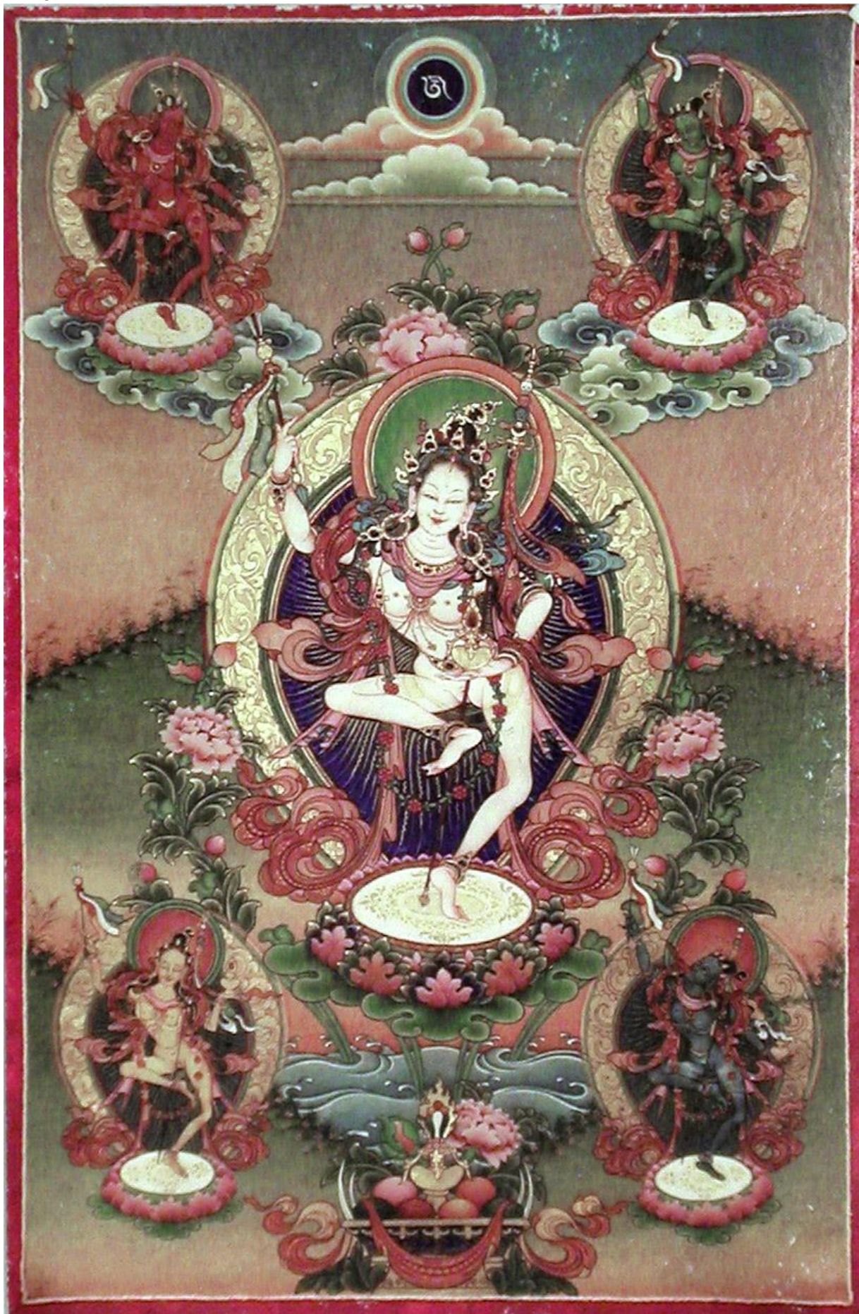
12) Công Chúa Mandarava (Một phối thân của Tổ Liên Hoa Sanh):