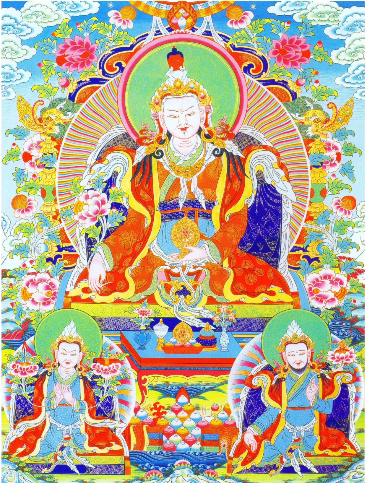
Hình 3 vị Pháp Vương: