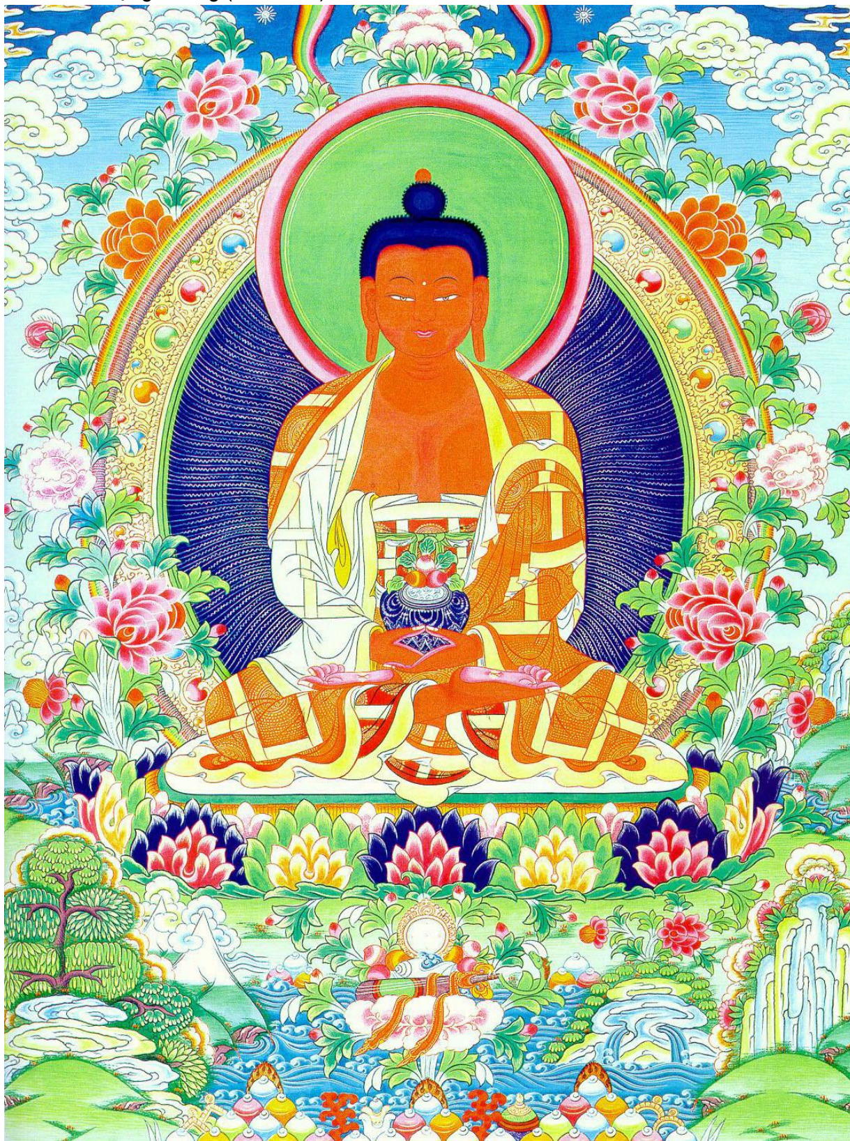
18) Di Đà Vô Lượng Quang (Amitabha):