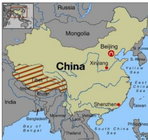
Bản đồ địa lý Tây Tạng

(Bon). Theo sử Phật giáo Tây Tạng ghi rằng vào năm 650, Vua Song Tán Tu Cam (Songtsen Gampo) đã thống nhất Tây Tạng và cưới công chúa Bạch Ly (Bhrikuti) của nước Nepal và công chúa Văn Thánh (Wen