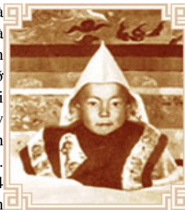
Đức Đạt Lai Lạt Ma lúc 3 tuổi

Cách lỗ (Gelugpa). Sau đó, cậu bé Lhamo Dhondup được đưa về tu viện Kumbum. Vị Lạt Ma thứ 14 tí hon này lúc đầu cũng rất buồn và nhớ song thân, anh chị em và bạn bè của mình, nhưng cũng may là có sư huynh của ngài là Lobsang Samten đã ở tu viện Kumbum trước đó, giúp đỡ ngài và thầy giáo thọ của ngài là một vị thầy già chuyên dạy học cho các chú sadi hình đồng cũng rất tốt và vui tính. Cuối cùng, vị Lạt Ma thứ 14 cùng với gia đình và tăng đoàn về đến thủ đô Lhasa.