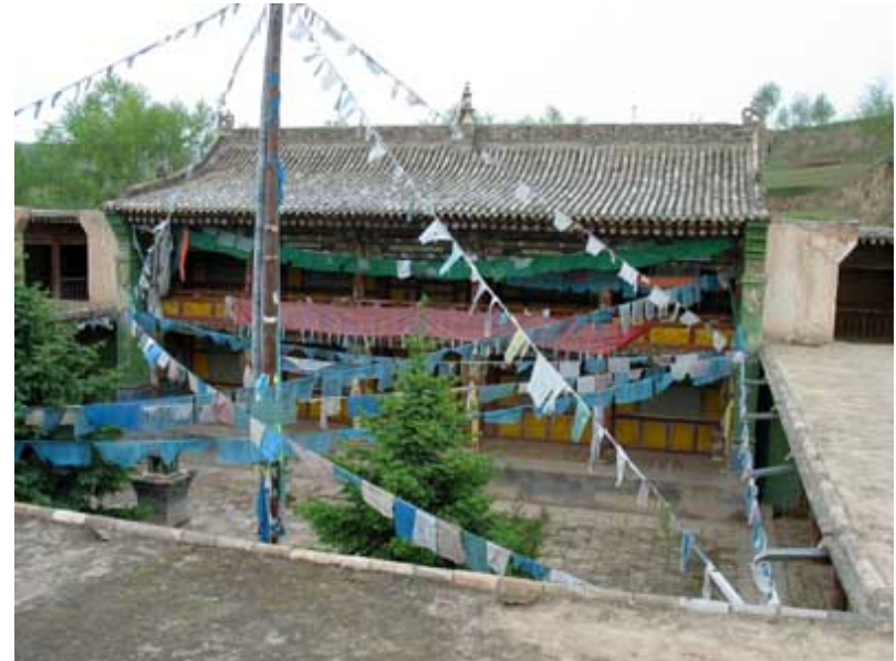
Ngôi nhà nơi Đức Đạt Lai Lạt Ma thứ 14 ra đời 6

tháng 07 năm 1935 trong một gia đình nông dân nghèo tại một ngôi làng nhỏ vùng Takster thuộc miền Đông Nam, tỉnh Amdo, Tây Tạng. Lhamo Dhondup nghĩa là Hoàn thành ý nguyện của Nữ Thần (Wish-Fulfilling Goddess) là tên thời thơ ấu của ngài. Lúc lên 2 tuổi, ngài được công nhận là hoá thân của Thubten Gyatso, Đức Đạt Lai Lạt Ma thứ 13 và ngài được đưa về thủ đô Lhasa để chính thức làm lễ tấn phong là Đức Đạt Lai Lạt Ma thứ 14