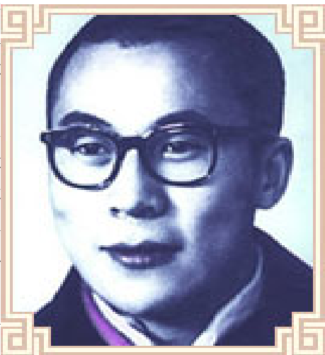
Đức Đạt Lai Lạt Ma Tenzin Gyatso lúc trưởng thành

Đức Đạt Lai Lạt bắt đầu sự nghiệp tu học của mình vào lúc 6 tuổi. Ngài được đưa vào các tu viện chuyên đào tạo các vị Lạt Ma tại thủ đô Lhasa. Ngài nhập chúng ở tu viện Jokhang để thể phát xuất gia, đắp y như một chú đệ tử và bắt đầu hành sự tu tập với pháp danh là Jamphel Ngawang Lobsang Yeshe Tenzin Gyatso, nói gọn là Tenzin Gyatso.