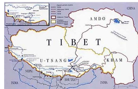
Bản đồ Tây Tạng 2

Một trong các vị Lạt-ma quan trọng nhất là ngài Tông Kha ba (Tsongkhapa), được mệnh danh là "nhà cải cách", bởi lẽ ngài thiết lập và tổ chức lại toàn bộ các tông phái. 2