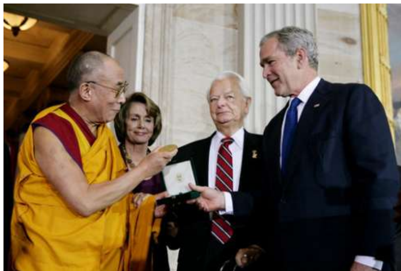
Cựu Tổng Thống Geogre W. Bush trao Huy Chương Quốc Hội Hoa Kỳ (Congressional Gold Medal) lên Đức Đạt Lai Lạt Ma vào ngày 17 tháng 10 năm 2007 (bên trái là Bà Nancy Pelosi, Ông Nghị viện Robert Byrd and Tổng thống Mỹ George W. Bush)

Tóm lại, Tenzin Gyatso, Đức Đạt Lai Lạt Ma thứ 14 là một hóa thân Bồ tát, một người đã suốt đời hy sinh thân mạng mình để mang lại an lạc và hạnh phúc cho con người. Ngài đã xuất hiện như một định mệnh để thừa kế dòng tái sinh huyền bí của trường phái Cách lỗ (Gelugpa) Mũ Vàng. Ngài đã giữ tước vị Đức Đạt Lai Lạt Ma, Nguyên thủ quốc gia Tây Tạng, trong một giai đoạn bấp bênh nhất trong lịch sử Tây Tạng. Hiện nay, vẫn trong thân phận người tị nạn lưu vong, tuy nhiên, ngài rất lạc quan và hạnh phúc trong sứ mạng đem ánh sáng Phật