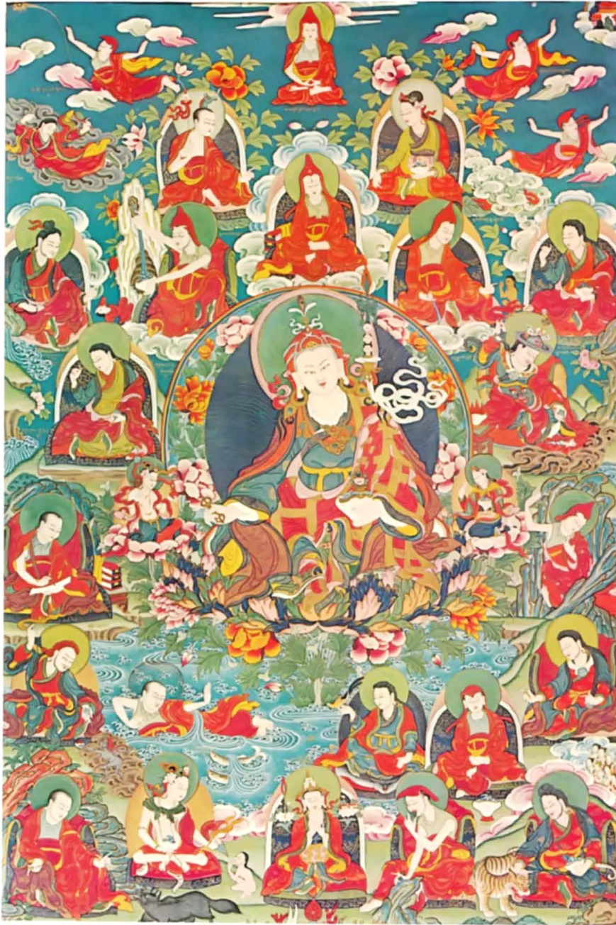
Plate 3: Guru Padmasambhava and 25 Disciples Đức Liên Hoa Sinh cùng 25 đệ tử