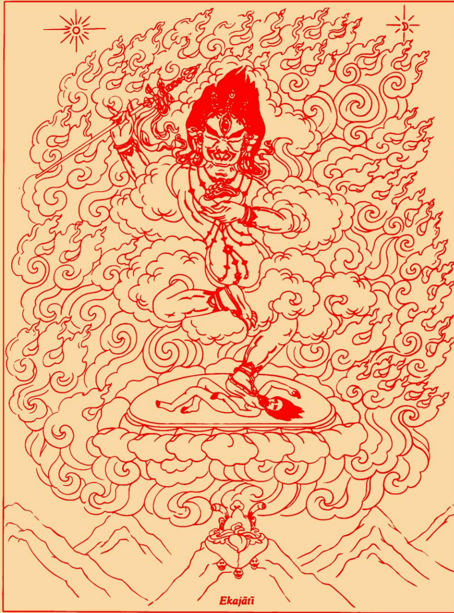
Hộ Pháp Đại Viên Mãn Ekajati