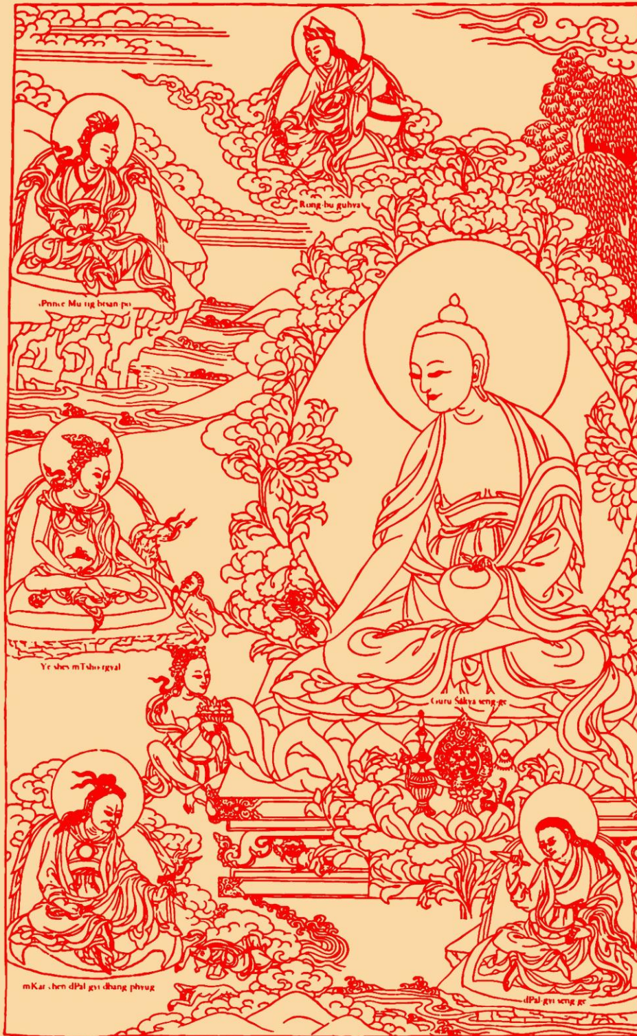
Guru Śākya seng-ge