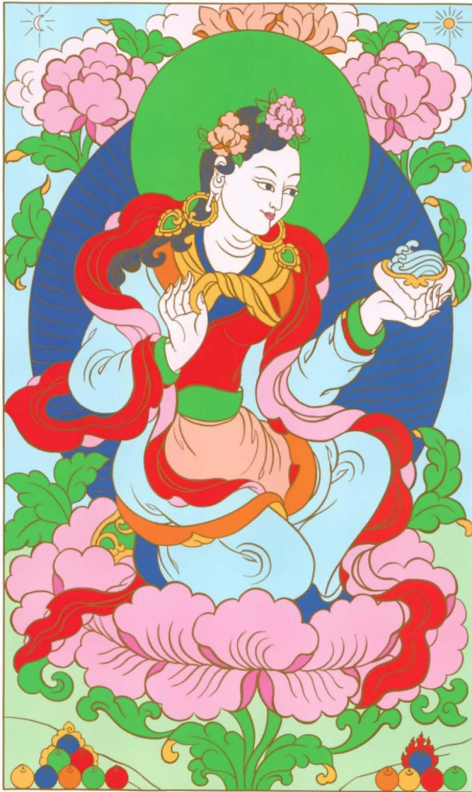
Plate 2: Ye-shes mTsho-rgyal