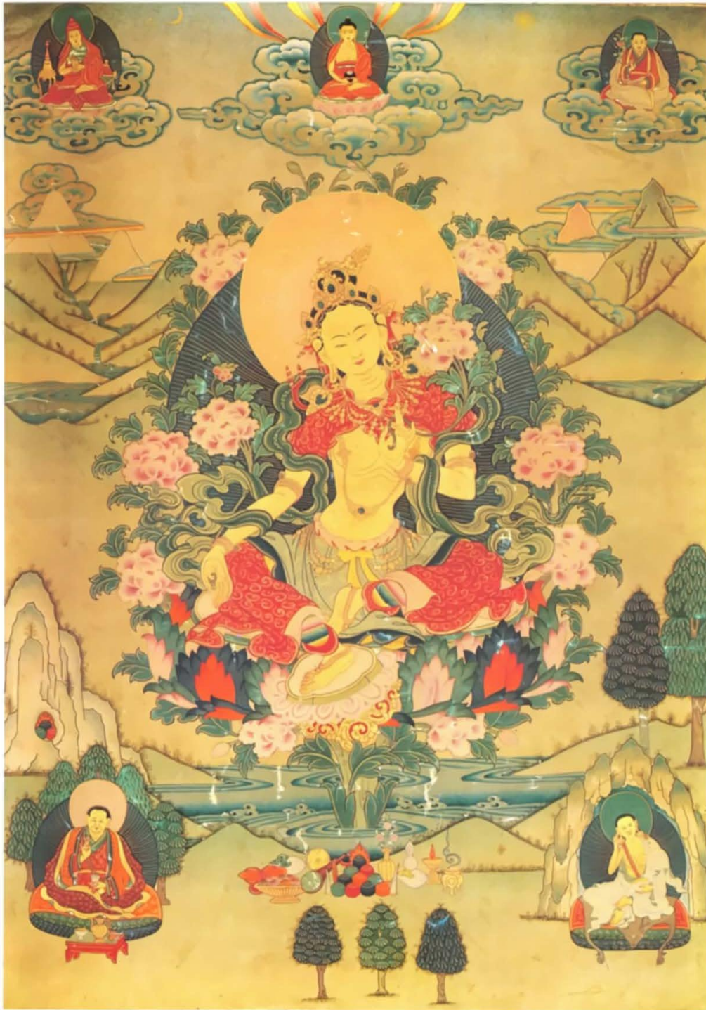
Đức Tara Trắng