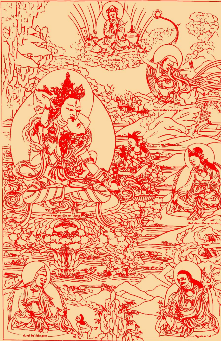
Orgyan rDo-rje 'chang