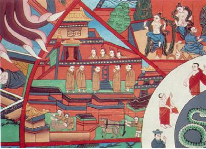
Hình 4: Cõi người và cõi trời.