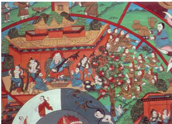
Hình 3: Cõi trời và cõi Thần.