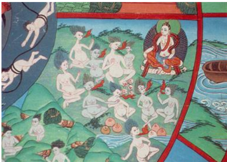
Hình 6: Cõi qui đỏi [nga qui].