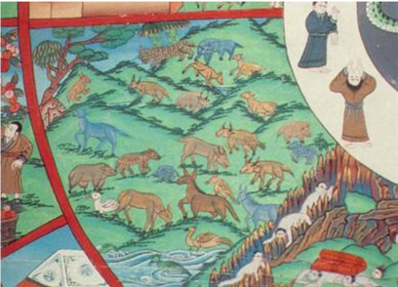
Hình 5: Cõi súc sinh.