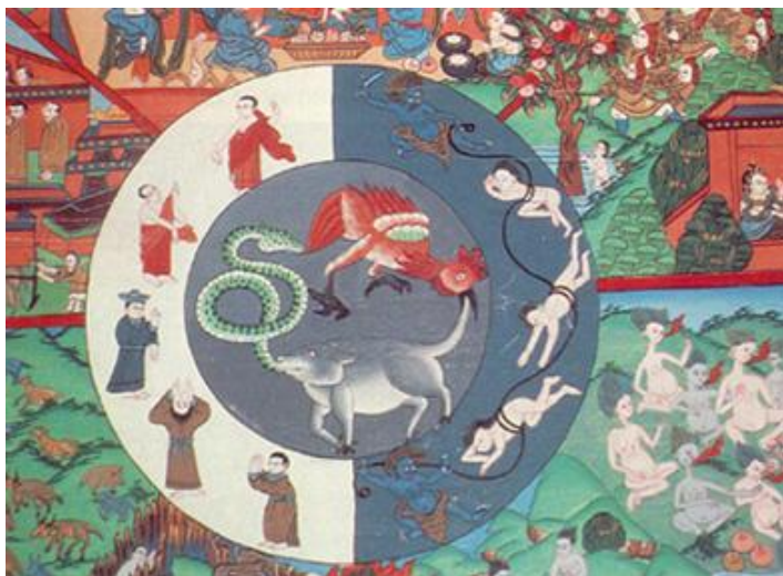
Hình 2: Ở giữa là nguồn gốc khổ đau: Tham (gà) Sân (rắn), Si (heo), bao quanh là những hành động thiện ác do tham sân si tác động.