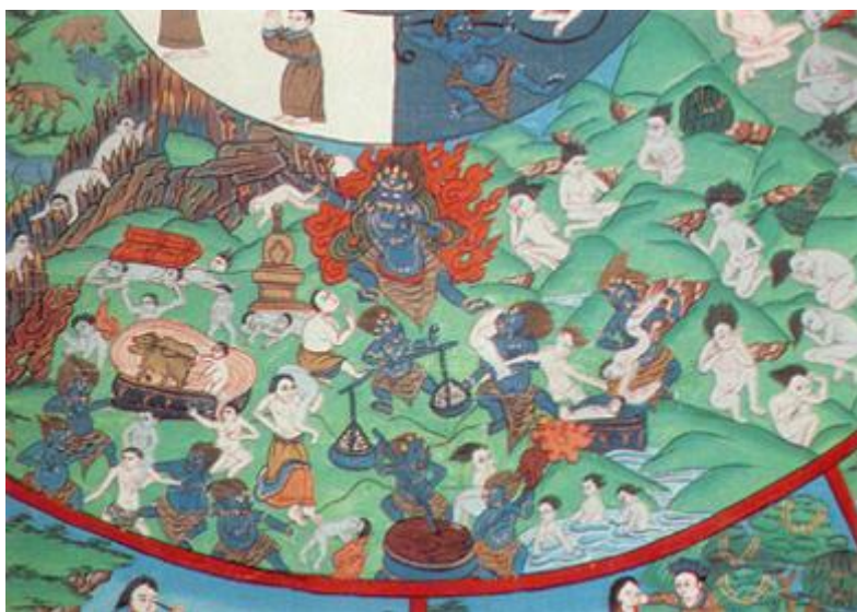
Hình 7: Cõi địa ngục